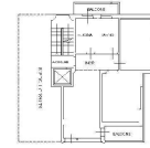
PIANTA PIANO SECONDO 42.00